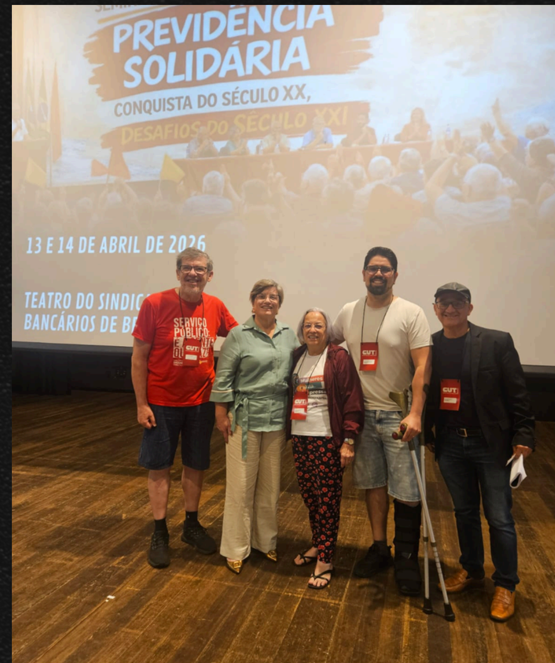
Seminário Nacional da Previdência Solidária (2026)