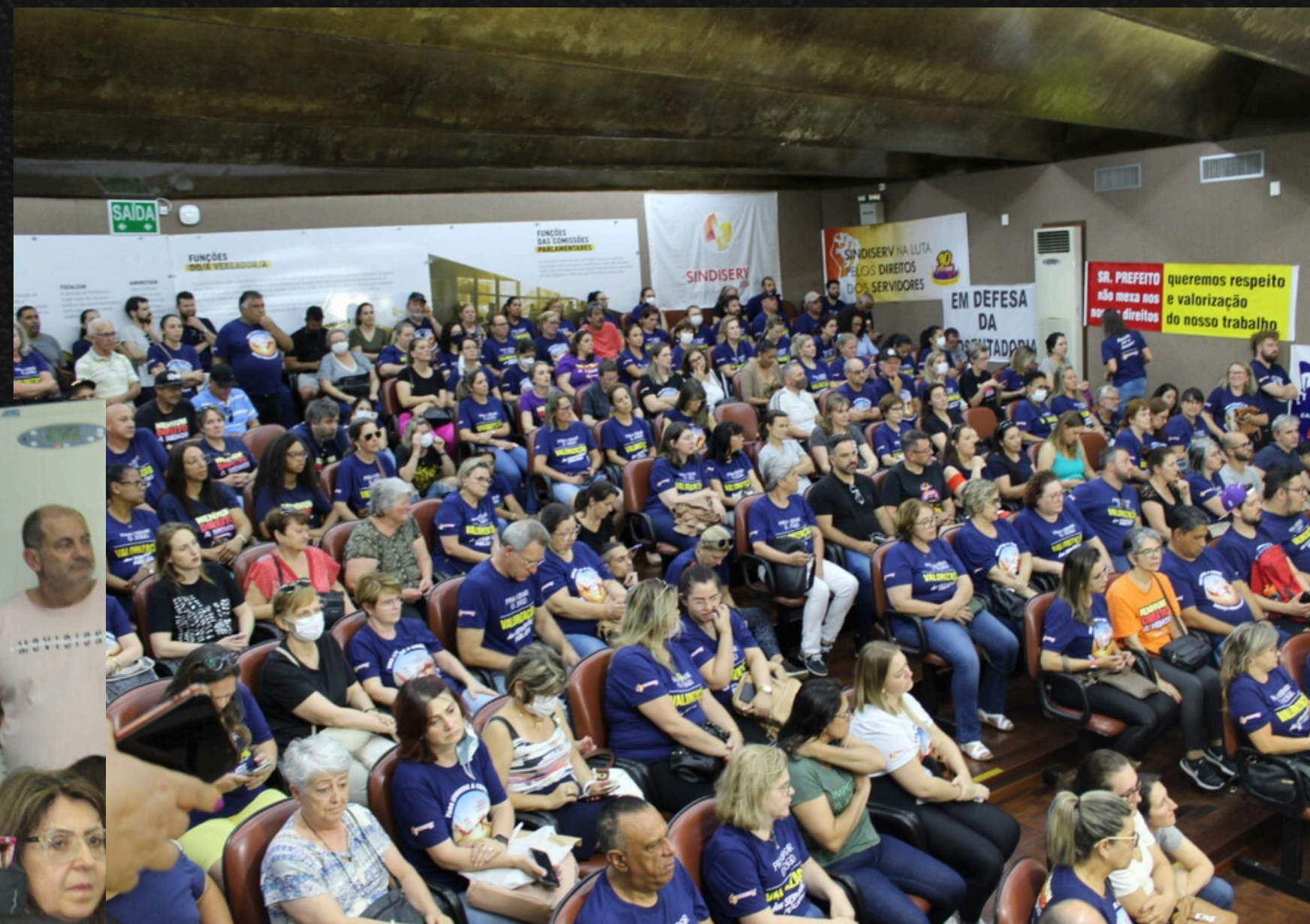
Delegados sindicais reunidos no auditório do Sindiserv (2022)