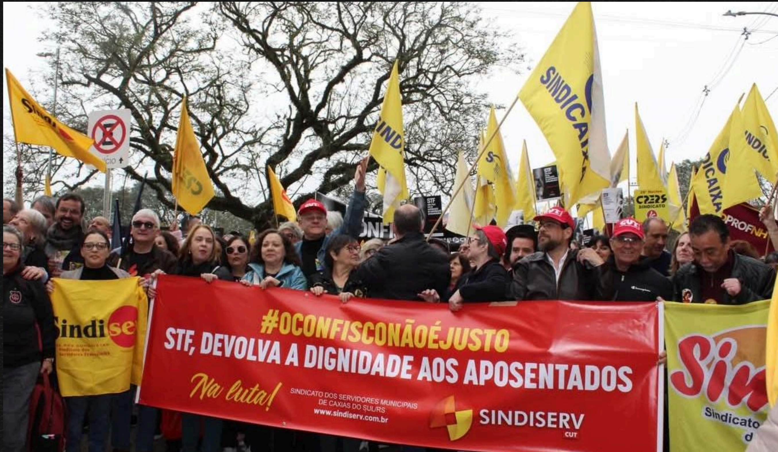
Servidores aposentados protestam em Porto Alegre contra cobrança de alíquota (2024)