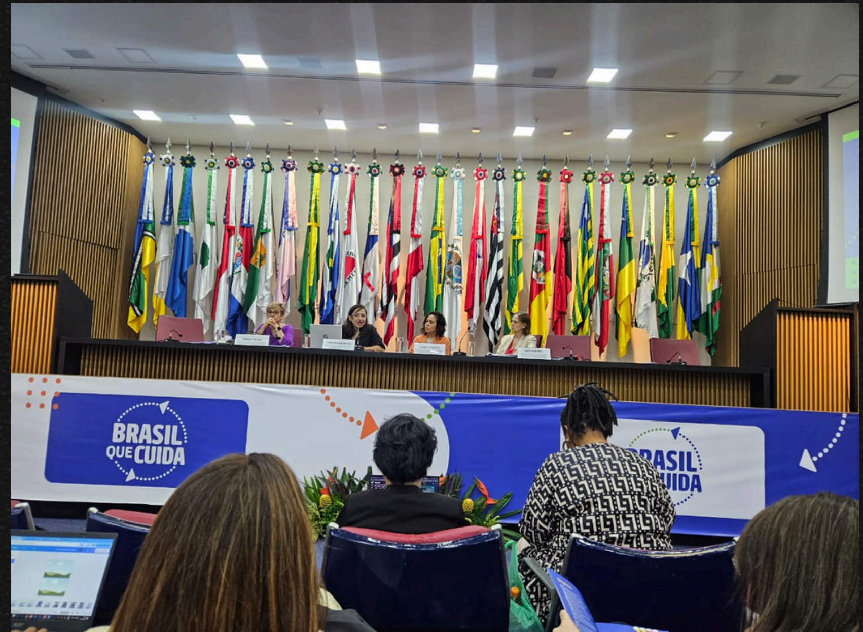
Conselho Nacional dos Direitos da Pessoa Idosa (2025)