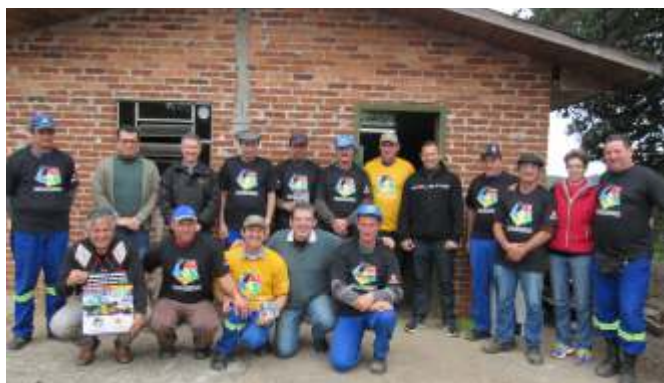
Subprefeitura Santa Lúcia