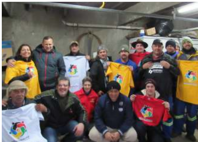
Subprefeitura Vila Oliva