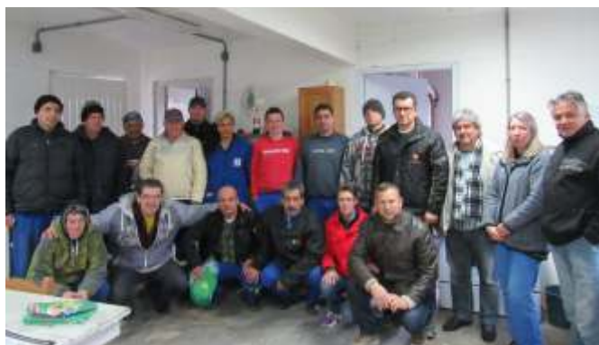
Subprefeitura Ana Rech