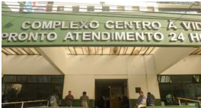
Mais agressões são registradas no PA

questões sobre o atendimento das Agentes Comunitárias de Saúde, avaliação de risco da enfermagem e problemas de segurança nas Unidades Básicas de Saúde e no PA (intensificação da guarda, porteiros, controle e horários de visita, entre outros), bem