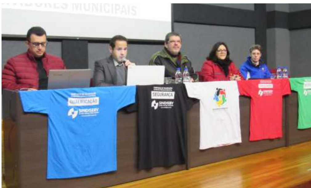
Ação servirá de modelo para servidores da região