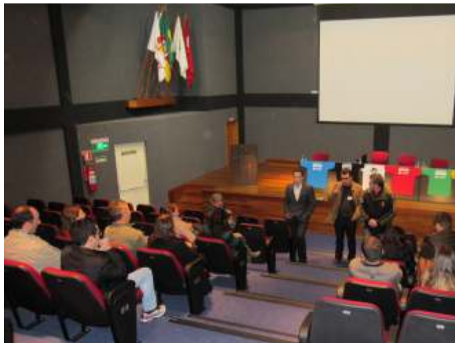
Interessados devem assinar procuração no Sindiserv

Justiça, que devem vir até o Sindicato e assinar procuração, já que as ações serão de forma individual. Na oportunidade também deverão apresentar os três últimos contracheques. Quem tiver alguma dúvida pode agendar hora para consulta jurídica junto ao advogado que assessora o Sindiserv. A direção do Sindicato também está a disposição para informações.